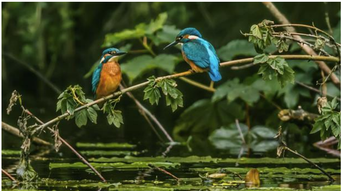
Eisvogel ( Alcedo atthis )

Die weitläufigen, über Jahrzehnte nicht gedüngten Wiesenflächen des Versetals bieten für den Natur- und Artenschutz eine vielversprechende Ausgangslage: Im Frühling prägen Schlüsselblumen, im Volksmund „Himmelsschlüssel“, mit ihren gelben Blüten das Tal wie an keiner anderen Stelle im Märkischen Kreis. Im Frühsommer kann man in der Verse dem glasklaren Ruf des Eisvogels lauschen und